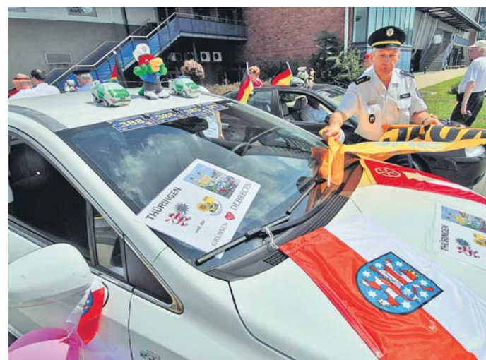
Sajátos hangulata van

társaság ügyfélszolgálati osztályvezetője. Kiderült, hogy a rendszeresen utazók számára kedveztek a hét végi és ünnepnapok, mivel ezek kitölték bérleteik érvényességének dátumát, tehát ezeken a napokon díjmentesen utazhattak. Az utasok számára talán némi vigasz lehet, hogy akinek több mint 15 nap van hátra a bérlet lejáratának idejéből, az a rendelet szerint fél áron visszaválthatja a szelvényét. HBN-KZ