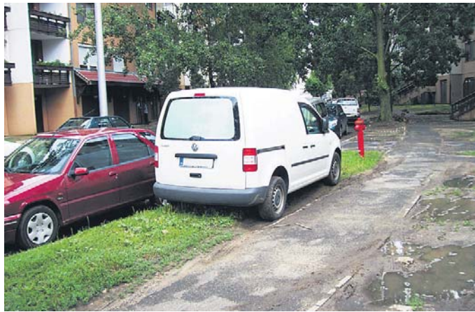
Egymás hegyén-hátán állnak